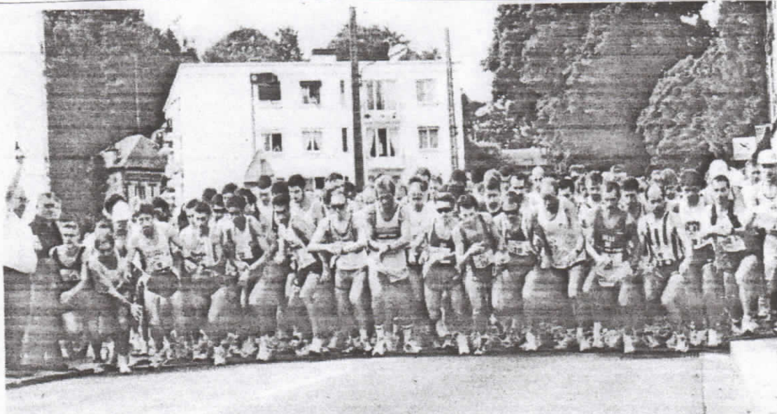
STARTSCHUSS zum Bolbecer Halbmarathon: Mehr als 600 Teilnehmer nahmen die Strecke in Angriff.