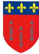
Ville de Bolbec