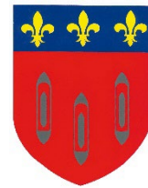
Ville de Bolbec