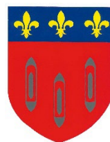
Ville de Bolbec