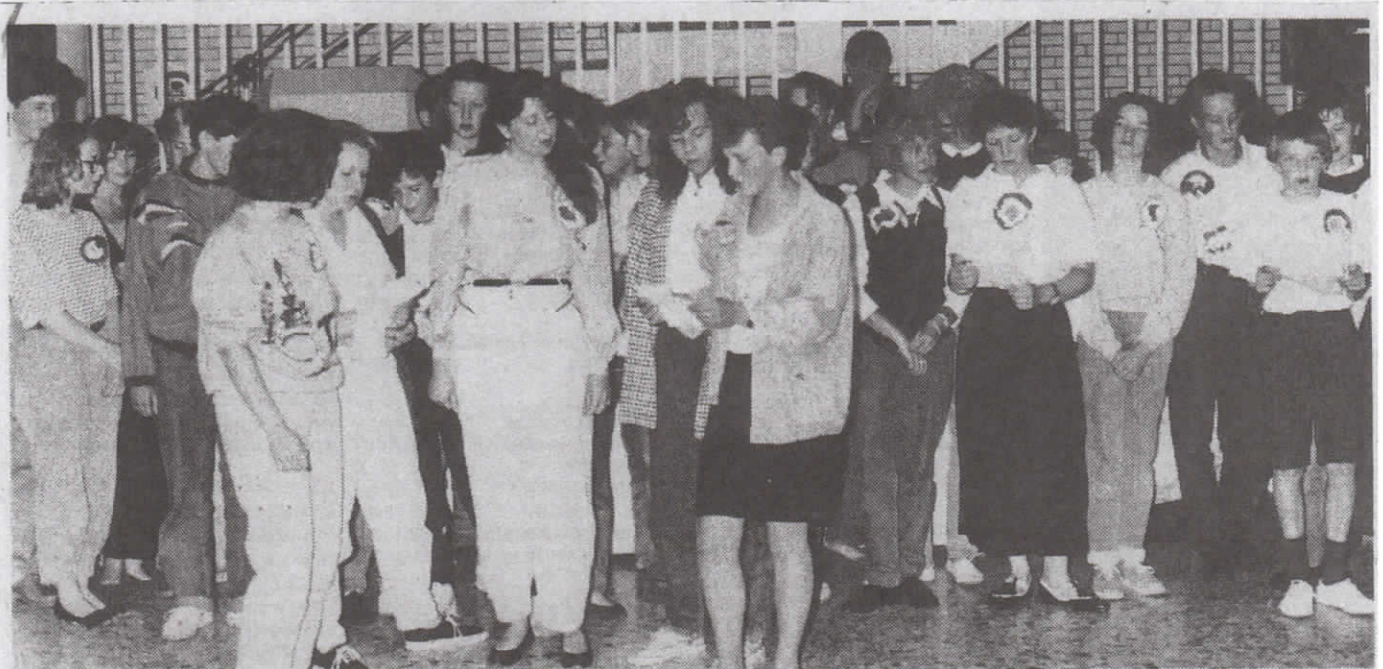
DIE FRANZÖSISCHE GRUPPE trug am Abschiedsabend, der auf den französischen Nationalfeiertag fiel, ein Revolutionslied vor.