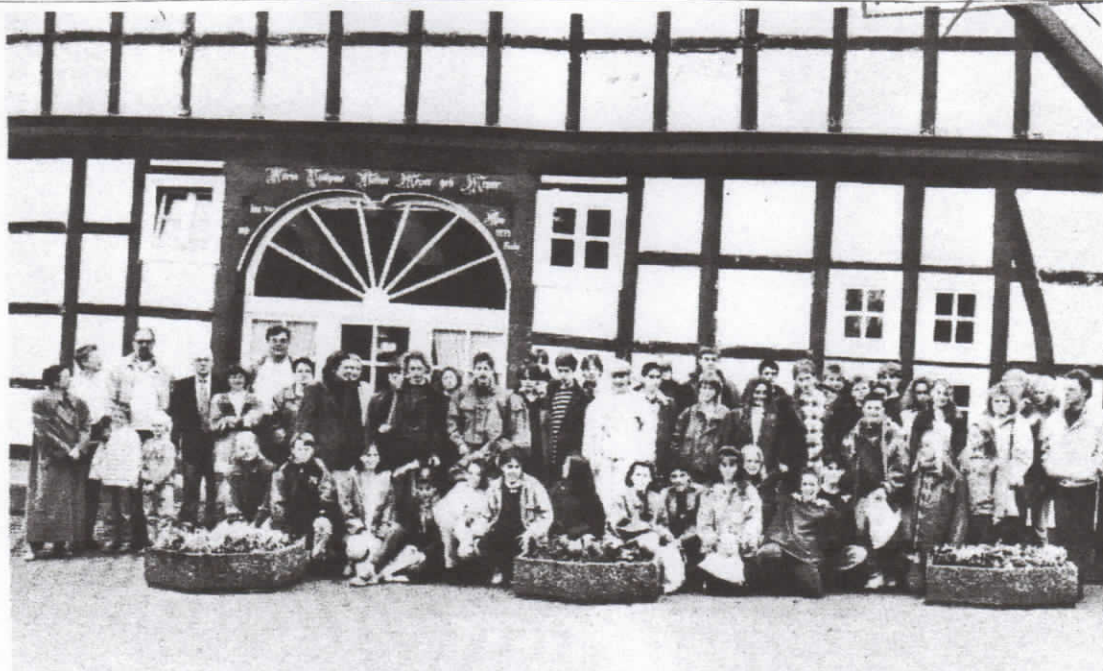
BÜRGERMEISTER Gerhard Hofmeyer begrüßte Schüler, Lehrer und einige Gasteltern in der Gemeinde Bad Essen. Im Bild die Gruppe vor den Räumen der Kurverwaltung.