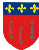
Ville de Bolbec